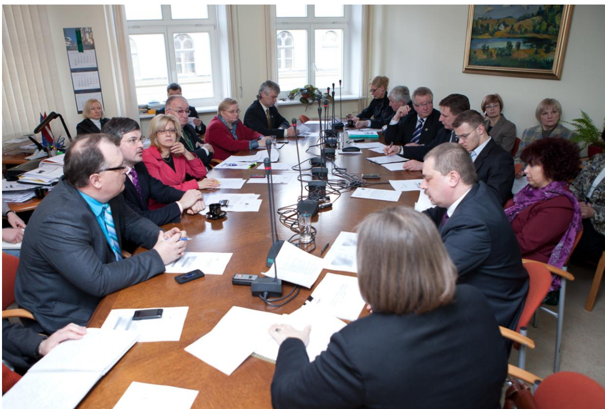
Komisijas 30.marta sēdē.

Liels kultūras notikums šovasar būs Ārzemju mākslas muzeja pārcelšanās uz jaunām telpām, tāpēc viesojāmie restaurējamajā Rīgas Biržas namā un pārrunāja muzeja plānoto darbību. Komisijas deputāti atzinīgi novērtēja ieceri muzejā sabalansēt mākslas izziņas un atpūtas iespējas, tajā izveidojot ne tikai modernas izstāžu zāles, bet arī semināru telpas.