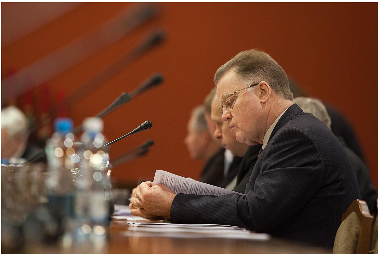
Komisijas sēdē. Priekšplānā deputāts G.Ulmanis.

Komisija izskata ar ārlietām saistītus tiesību aktus, kā arī veic parlamentāro kontroli pār ārlietu jomu. Pirms apspriešanas Saeimas sēdē komisija izskata un lemj par starpvalstu līgumiem, Latvijas pievienošanās starptautiskām konvencijām, kā arī citiem ar ārlietām saistītiem jautājumiem. Komisijā tiek saskaņotas mūsu valsts ārpolitikas nostādnes un priekšlikumi starpvalstu attiecību attīstībai. Komisija izskata un apstiprina nominēto Latvijas vēstnieku kandidatūras, tās viedoklis ir rekomendējošs Valsts prezidentam, kurš ieceļ vēstniekus amatā. Tāpat komisija vērtē Latvijas vēstniecību darbu. Komisija arī veic aktīvu darbu starptautiskajā līmenī, skaidrojot valsts ārpolitikas nostādnes.