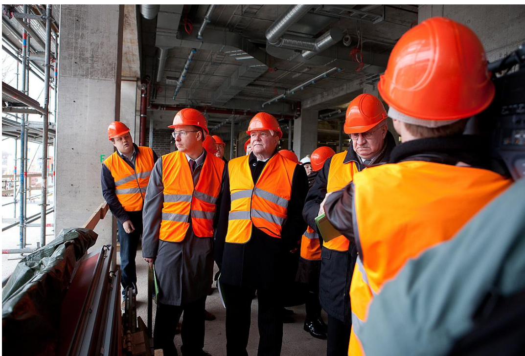
Komisijai izbraukuma sēdē apmeklē Latvijas Nacionālās bibliotēkas būvlaukumu.

Komisijas darbības joma ir četras Latvijas tautsaimniecībai nozīmīgas un savstarpēji saistītas nozares – izglītība, kultūra, zinātne un sports. Komisija izskata šo nozaru likumprojektus, veic parlamentāro kontroli pār attiecīgajām ministrijām un to padotības iestādēm, kā arī izskata iesniegumus, sūdzības un priekšlikumus. Izglītības, zinātnes, sporta un kultūras nozaru budžets, skolu tīkla sakārtošana, Latvijas zinātnieku sasniegumi un izaicinājumi, muzeju pārtapšana par mūsdienīgiem kultūras centriem, pieminekļu aizsardzība un jaunu kultūras objektu būvniecība ir tikai dažas no tēmām, par kurām ikdienā spriež komisijas deputāti. Komisijas redzeslokā ir ne tikai atsevišķu nozaru aktualitātes, bet arī stratēģiskie valsts mērķi un Latvijas ilgtspējīga attīstība. Sagatavojot likumprojektus un izskatot nozares problēmjautājumus, komisijas sēdēs piedalās atbildīgo ministriju ierēdņi, pašvaldību vadītāji, izglītības, zinātnes, kultūras un sporta darbinieku organizāciju pārstāvji. Lai padziļinātu komisijas darbu sporta jomā, izveidota Sporta apakškomisija.