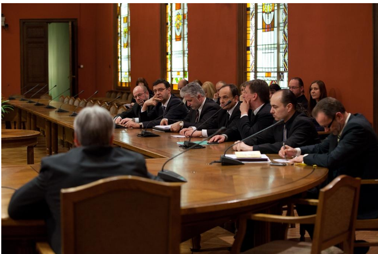
Komisijas 31.marta sēdē.

Komisija pēc 40 deputātu ierosinājuma izveidota 2011.gada 24.februārī. Tās uzdevums ir izmeklēt, vai A/S „Parex banka” pārņemšanas un restrukturizācijas procesā pieļautas pretlikumības. Darbam komisijā deleģēti divi pārstāvji no katras Saeimas frakcijas.